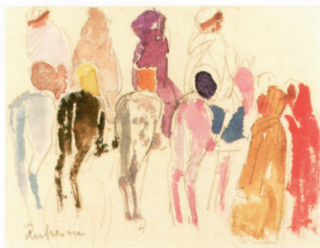
Les Cavaliers, 1910-1914