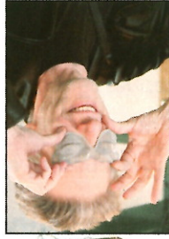
David Cronenberg fait mouche avec son masque.