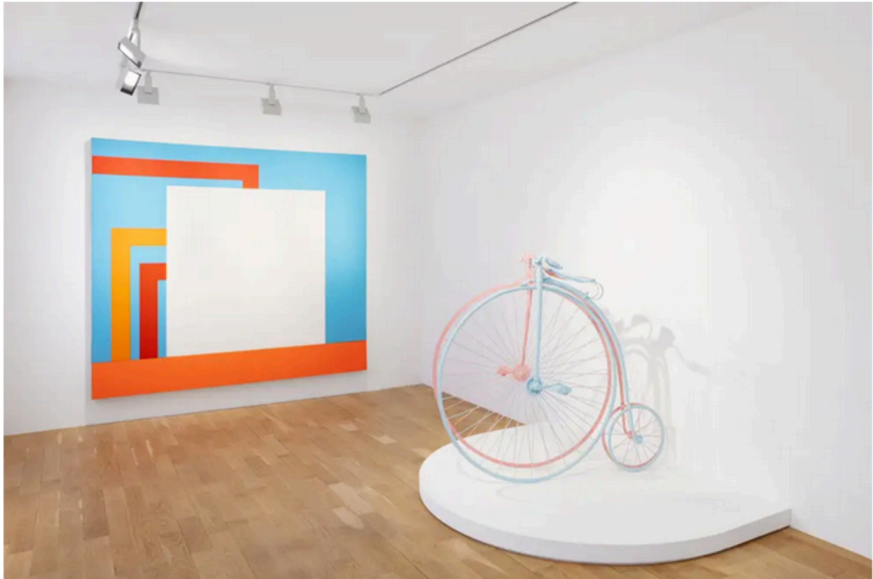
Vue de l'accrochage inaugural de Perrotin Second Marché, avenue Matignon.

Mais si la plupart de ces espaces se limitent à des appartements ou un rez-de-chaussée , Emmanuel Perrotin s'est offert de son côté un immeuble entier qu'il consacrera au second marché – soit la revente d'œuvres déjà acquises une première fois avant d'être remises en vente. Au numéro 8 de l'avenue Matignon, le galeriste reprend l'adresse anciennement occupée par la galerie Yoshii : au total, cinq étages et 400 m 2 de surface d'exposition situés en face de la maison de vente Christie's, à quelques mètres seulement des autres géants des enchères Sotheby's, Artcurial et Piasa, et même du Grand Palais, qui accueille chaque année la Fiac. Toutes les conditions semblent réunies pour que la galerie développe ce secteur jusqu'alors plus confidentiel de son activité. Davantage connue pour l'art contemporain et le premier marché, la galerie a développé son implication dans le second marché en 31 ans d'existence à mesure que son réseau de collectionneurs s'est étendu et que leurs attentes se sont diversifiées, en acquérant de nombreuses pièces d'exception d'artistes présents dans les collections les plus prestigieuses. Aujourd'hui, en plus de ses 56 artistes vivants, la galerie représente par ailleurs six estates d'artistes disparus, tels qu'Alain Jacquet, Jesús Rafael Soto ou encore Hans Hartung, récemment mis à l'honneur entre ses murs à travers une exposition d'ampleur composée de plusieurs toiles exceptionnelles.