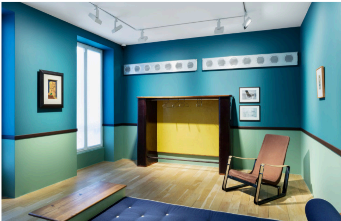
Vue de l'exposition « La Cité Universitaire de Jean Prouvé » à la galerie Perrotin Matignon réalisée en collaboration avec la Galerie Downtown/ François Laffanour, Paris 2023. ©All artists / ADAGP Paris, 2023.