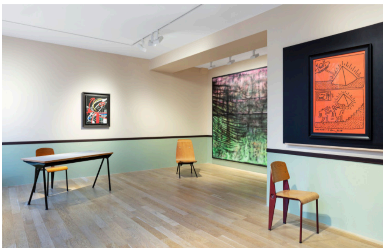
Vue de l'exposition « La Cité Universitaire de Jean Prouvé » à la galerie Perrotin Matignon réalisée en collaboration avec la Galerie Downtown/ François Laffanour, Paris 2023. Courtesy of Laffanour / Galerie Downtown Paris and Perrotin. ©All artists / ADAGP Paris, 2023.