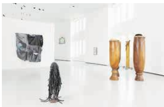
Vue de l'exposition de David Hammons.