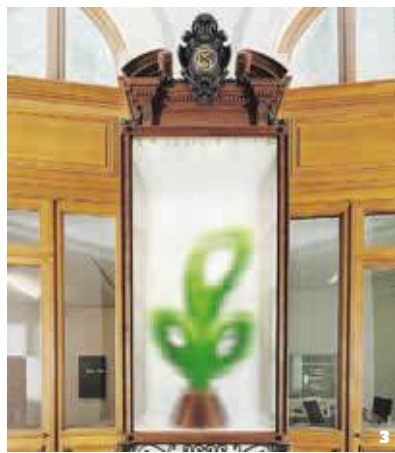
Quelques-uns des chefs-d'œuvre contemporains de la Collection Pinault : Red Canoe , de Peter Doig, 2000 (1) ; Untitled , d'Urs Fischer, 2011 (2) ; Walt Disney Productions n°6 , de Bertrand Lavier, 2018 (3) ; Souris animatronique, trou dans un mur , de Ryan Gander, 2019 (4).

critique de l'image devient l'enjeu de la photographie.