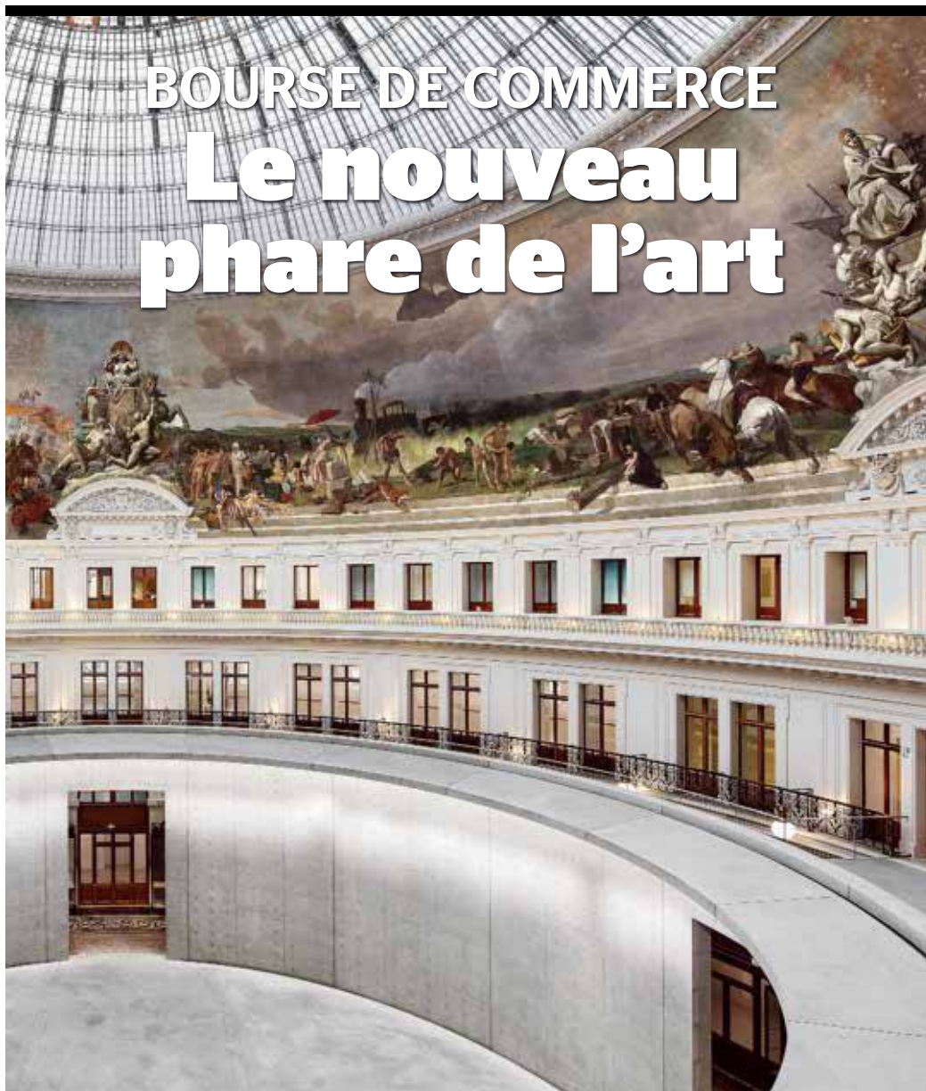
© TADAO ANDO ARCHITECT & ASSOCIATES, NINEY ET MARCA ARCHITECTES, AGENCE PIERRE - ANTONIE GARNIER PHOTO PATRICK TOUNIBEBEUF