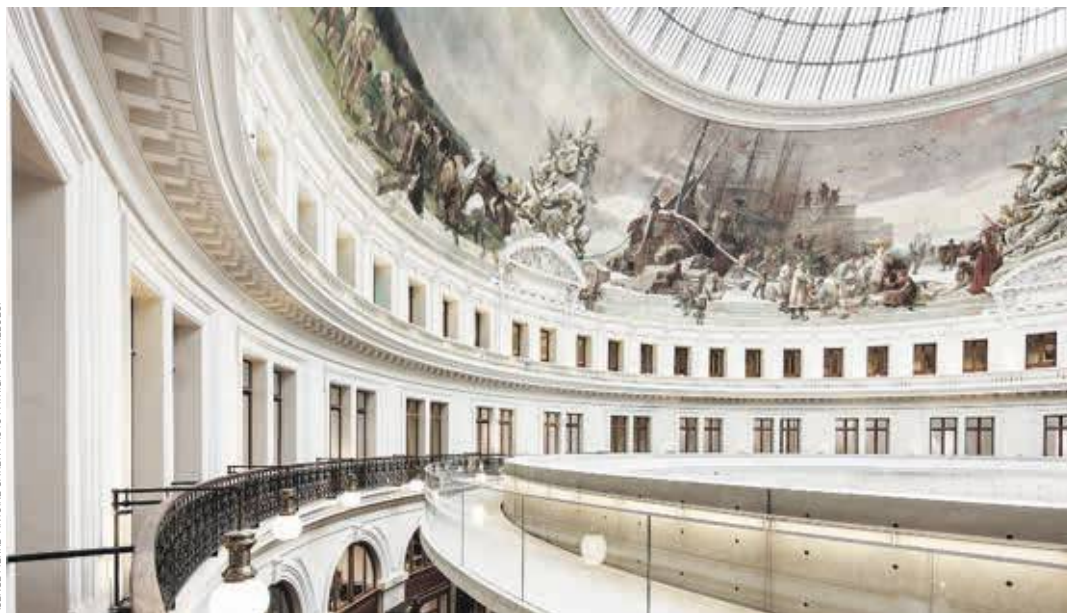
Sous la majestueuse coupole historique, le cylindre de Tadao Ando – 9 mètres de haut par 29 mètres de diamètre – dessine le parcours d'exposition.